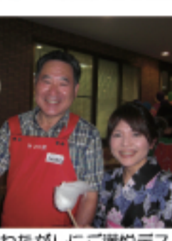
たくさんの方々の ご来苑ありがとうございました。