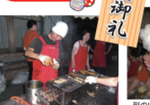
塩・こしょうが命!!