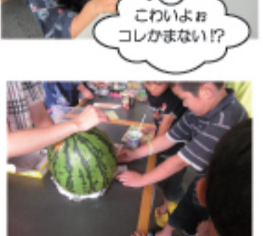
このスイカけっこう重かったよ!