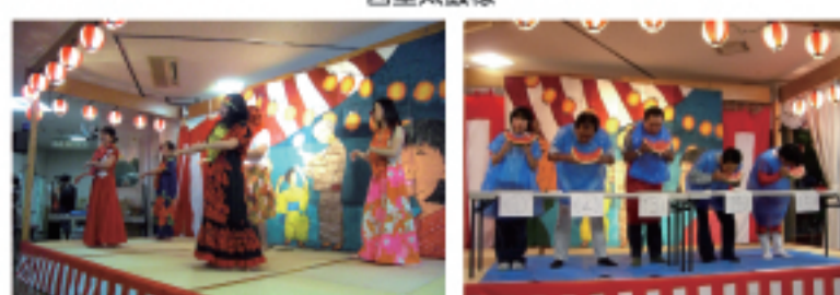
職員によるなんちゃってフラガール★