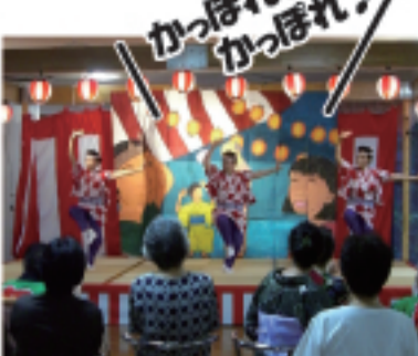
梅后流江戸芸かっぱれ様