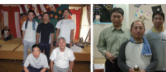
お疲れさまでした!